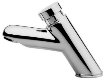
Figura 5-Modelo de torneira a ser utilizado

torneira deverá ter uma distância entre o eixo da entrada de o eixo da saída de água de no mínimo 11 cm. Abaixo imagem ilustrativa: