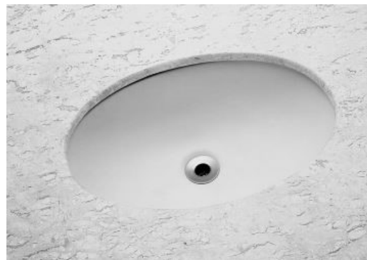
Figura 4-Modelo de pia a ser seguido

Nos sanitários, o projeto arquitetônico considerou o emprego de bancadas em granito 100x50, altura de 15 cm e rodabanca de 10 cm, conforme detalhe em projeto. com cuba de embutir oval, em louça na cor branco, 35x50.