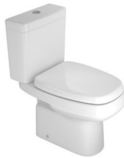
Figura 3-Modelo de bacia sanitária infantil