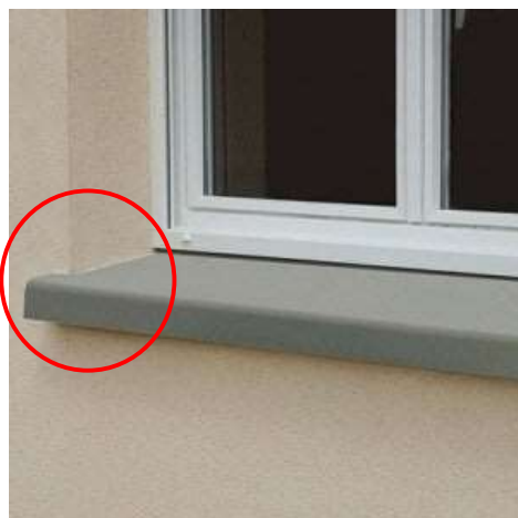
Figura 2- Peitoril embutido 1 cm na alvenaria

Todas as janelas terão peitoris em granito cinza polido andorinha e= 2cm e largura 17cm, embutidas 1 cm para cada lado da alvenaria, conforme foto a seguir. Todas as portas terão soleira em granito cinza polido andorinha e= 2cm e largura 15cm. As portas internas serão providas de fechadura simples, de embutir, tipo alavanca, de ferro cromado completas, fixadas com três dobradiças de 3". As dobradiças e respectivos parafusos serão de ferro zincado.