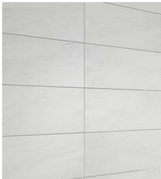
Figura 1- Modelo de cerâmicas banheiros