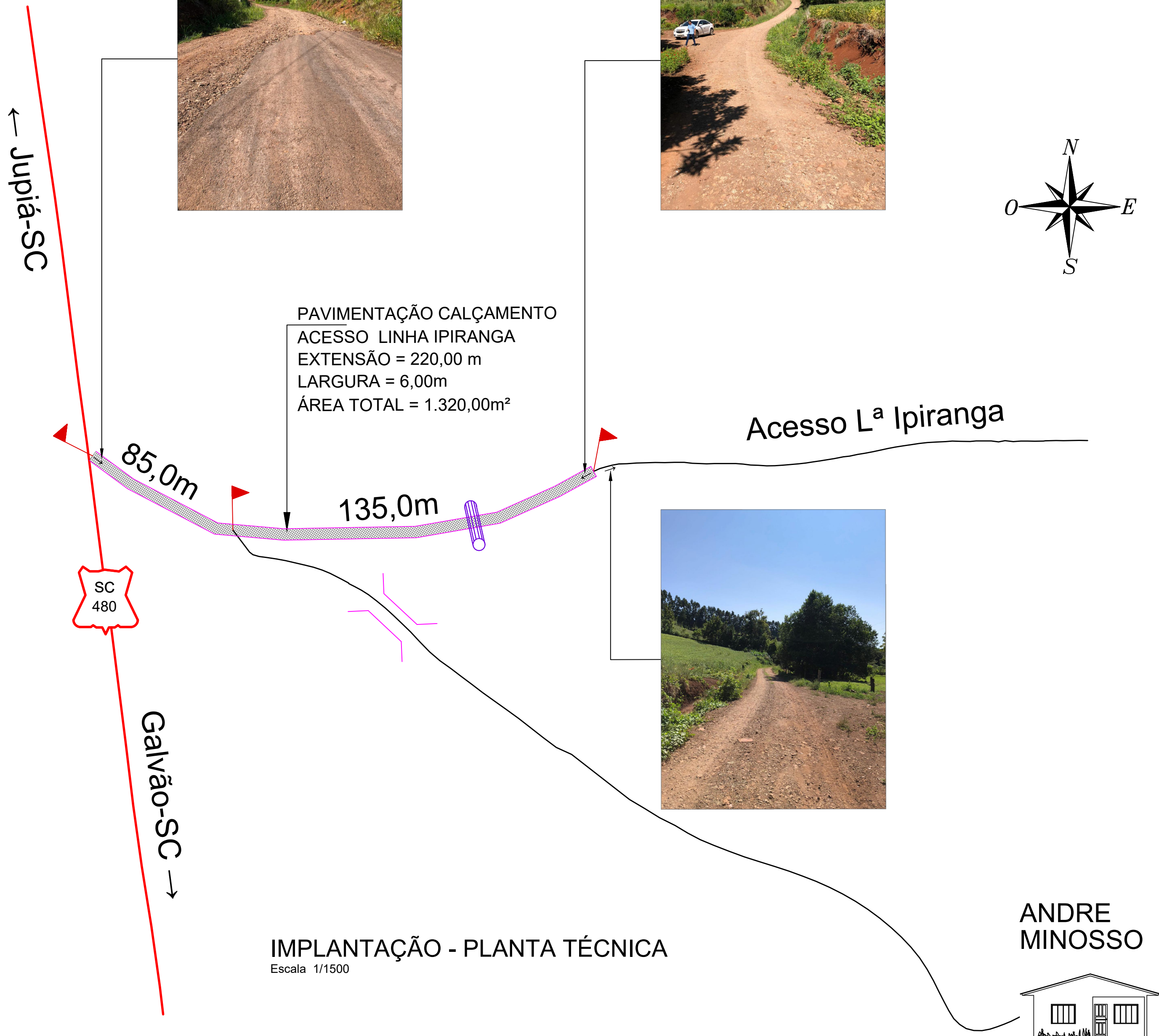
IMPLANTAÇÃO - PLANTA TÉCNICA Escala 1/1500