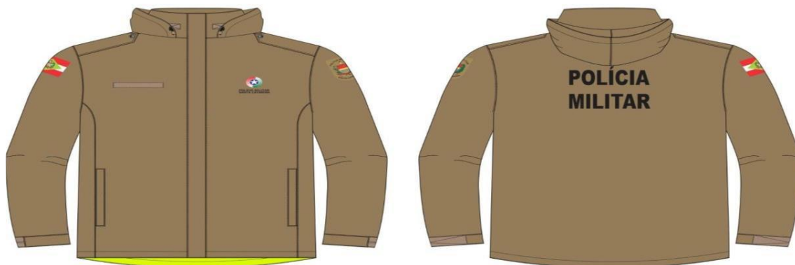
JAQUETA LADO EXTERNO